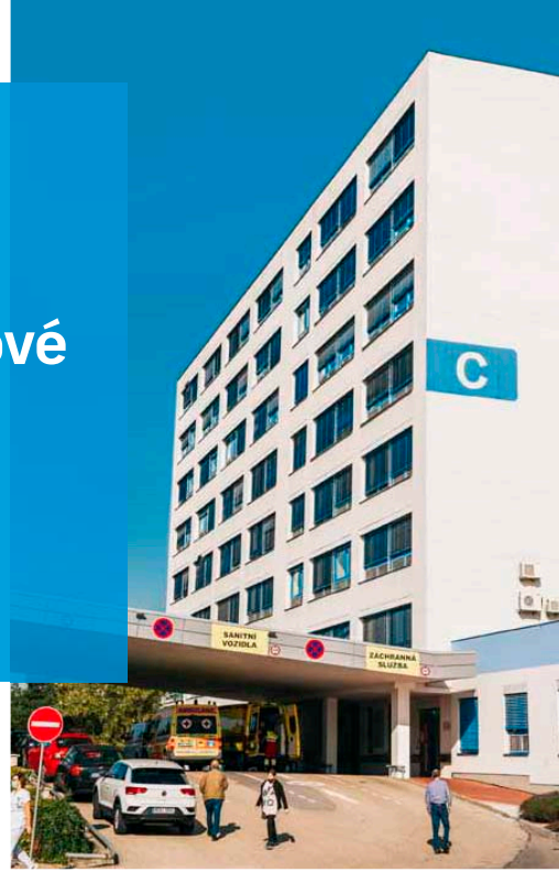
Vstup do přízemí pavilonu C